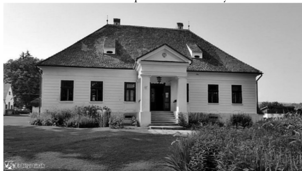
A Damokos kúria az alapkiállítás színhelye