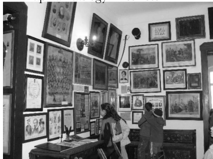
Az Alapkiállítás egyik részlete