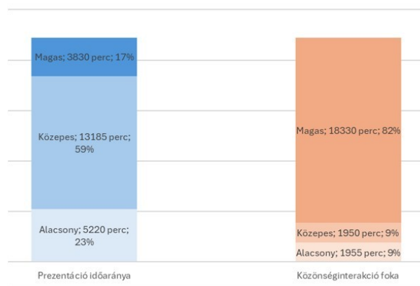
2. ábra: A konferencia teljes idejének (összesen 44 470 perc) megoszlása a prezentációs idő és a közösséginterakció mértéke szerint: alacsony, közepes és magas szintű szekciótípusok arányai.

Az 1. mellékletben látható, hogy a POD-adatokon végzett elemzést követően a továbbiakban bemutatásra kerülő másik három konferencia szekciótípusait is elemeztük, és besoroltuk a POD elemzési dimenziói mentén az alacsony, a közepes és a magas kategóriákba.