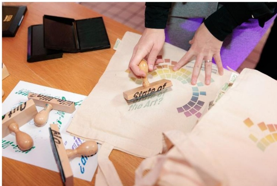
4. ábra: A Galériaséta egyik állomása