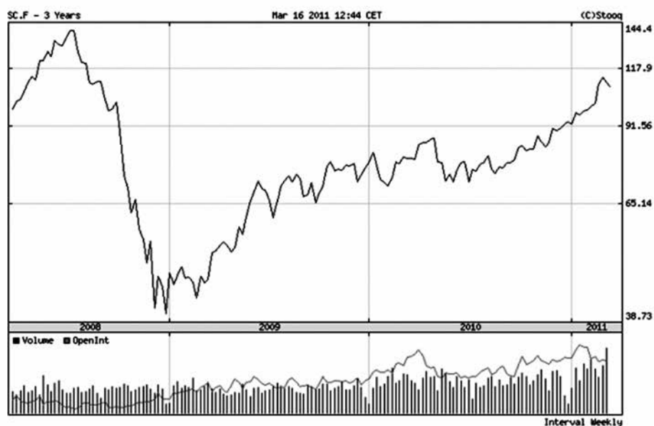
„Brent” minőségű kőolaj északi-tengeri határidős jegyzési árai, 3 éves időszakra