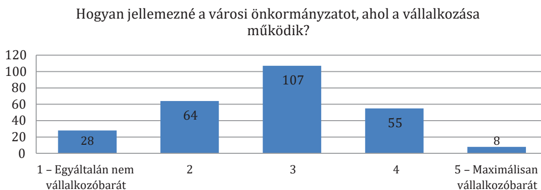
3. ábra. A vállalkozások véleménye a vállalkozóbarát önkormányzatról

Ugyanakkor a teljes képhez az is hozzátartozik, hogy a létező együttműködési formákat 1/3-1/3 arányban a válaszadók azért sem tartják sikeresnek, mert úgy gondolják, hogy a vállalkozásoknak nincs elég erejük a döntéshozatal befolyásolására, illetve a döntések eleve magasabb szinteken születnek, amelyekre nem lehet a helyi szintnek befolyása.